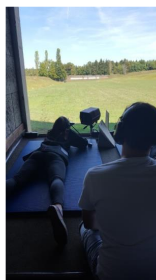
Quelques finalistes broyards, sous le regard attentif de leurs moniteurs.