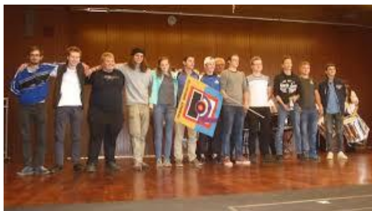
Les douze finalistes fribourgeois, Champions romands par canton, catégorie Jeunes tireurs